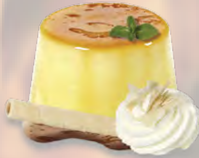
Caramelchöpfli hausgemacht mit Rahm (30) CHF 7.50