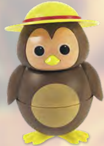
Birdy Speiseeis Schokolade (32) CHF 6.50