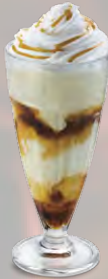
Caramelita Caramel- und Vanille-Rahmglace mit Caramel-Sauce und Rahm (29) CHF 9.50