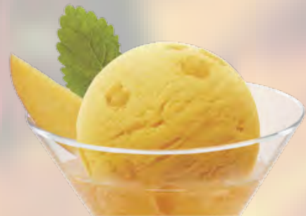
Mango Mango-Sorbet mit Prosecco (26) CHF 12.50