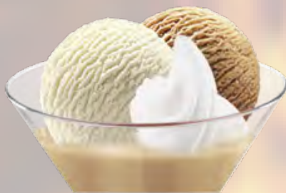
Baileys Vanille- und Café-Rahmglace mit Baileys und Rahm (25) CHF 12.50