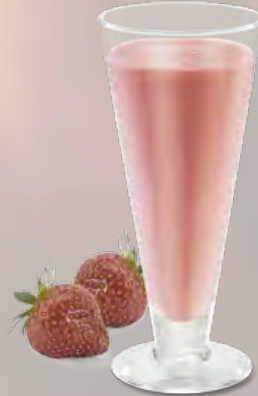
Frappé in diversen Aromen (37) CHF 8.00