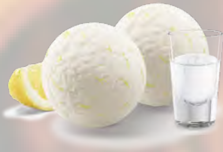
Le Colonel Zitronen-Sorbet mit Wodka (23) CHF 12.50