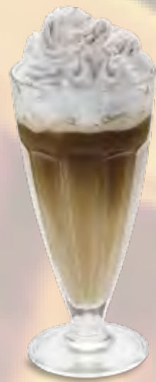
Ice Café Café-Rahmglace mit Rahm (28) CHF 9.50