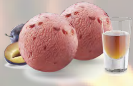
Zwetschge Zwetschgen-Sorbet mit Vieille Prune (24) CHF 12.50