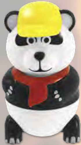
Panda Speiseeis mit Vanille Geschmack (31) CHF 6.50